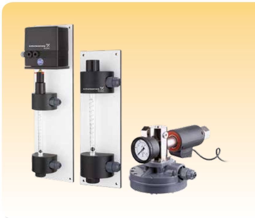
VACCUPERM VGA-117 & VGA-146

Han sido diseñados para un funcionamiento completamente automatizado, para instalaciones murales o de cabina, y con unas capacidades de dosificación regulables y precisas de hasta 200 kg/h mediante una sola unidad de dosificación.