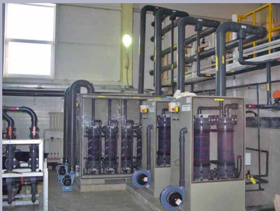
Instalación de electrocloración Selcoperm hasta 900 kg/día