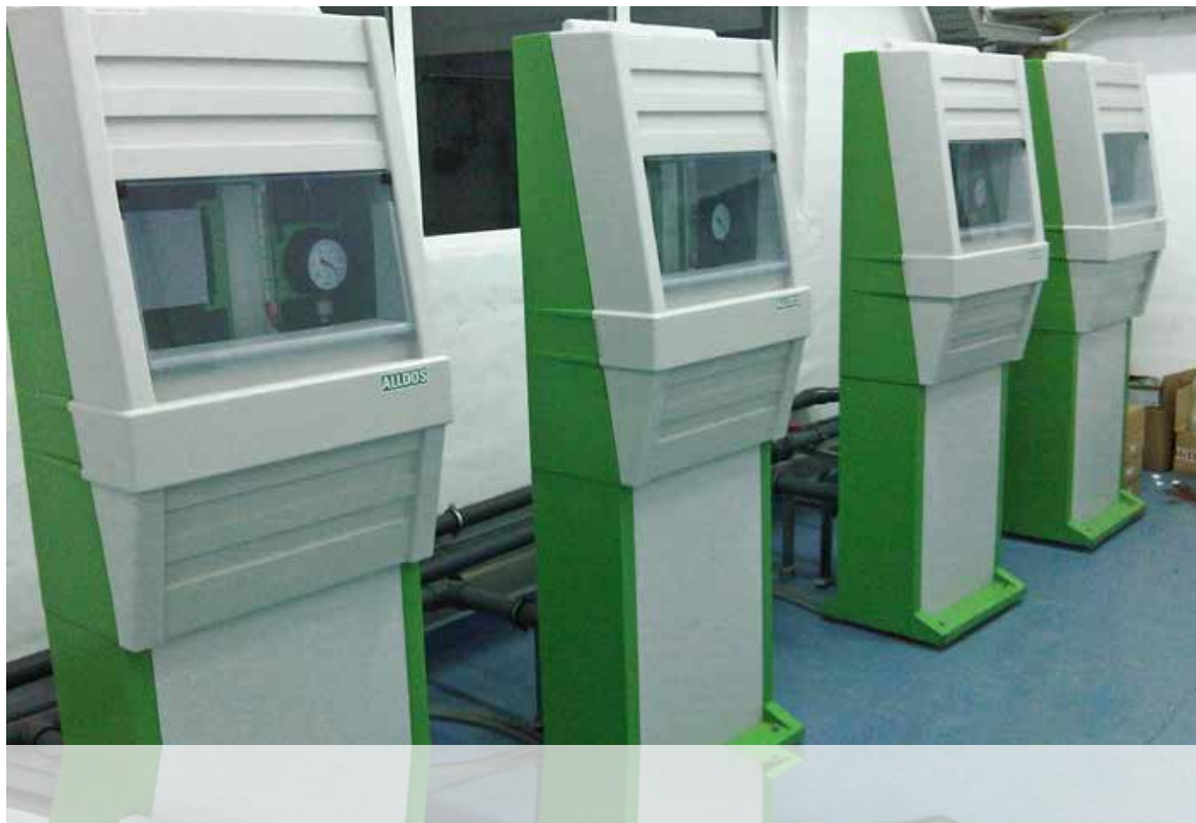
Instalación de cabinas de dosificación Serie VGS-140